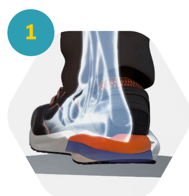
1 Amortecimento de movimento

K-POP está desenhado para garantir um conforto dinâmico, graças ao sistema patenteado de geometria variável i-daptive® , que muda de posição dependendo do trabalho e do tipo de terreno.