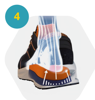
4 Estabilização do pé