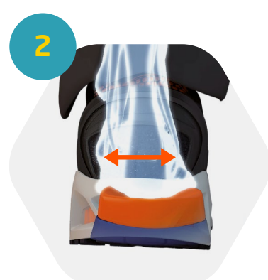
2 Dissipação de energia